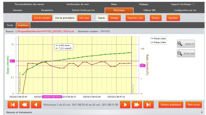
Historique de mesure de dose