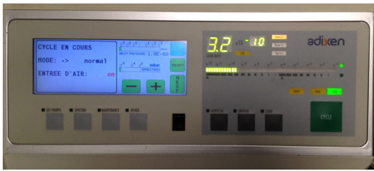
Taux de fuite < 1.10 -9 mbar.L.s -1 (He)