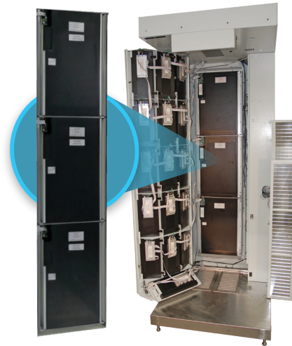
Détecteurs gamma Zeus