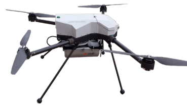
SPiR-Explorer Sensor monté sur un drone AERACCESS.