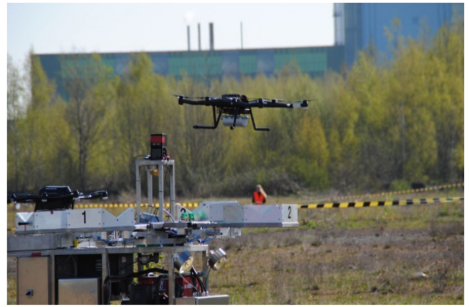
Drone équipé d'un SPiR-Explorer Sensor atterrissant sur une plate-forme.