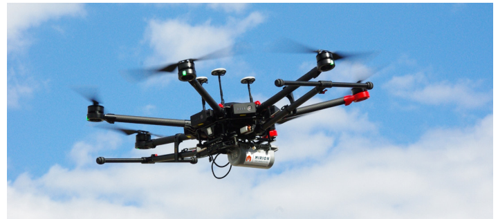
SPiR-Explorer Sensor en fonctionnement.